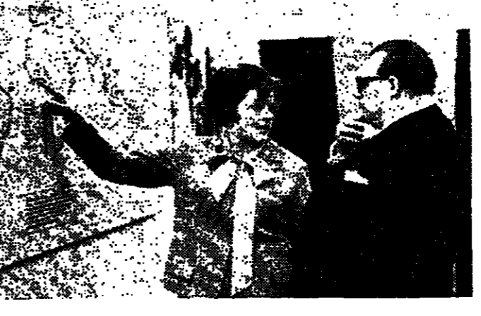
برلين « ان ب » - الاتحاديون احدث الاساليب يودي الى زبنة

استقبل - روبر - قالت مصان اليوليس ان اليوليس اكتشف حقة تتعلق بجوازات السفر وتالفات المور وتكون الاتامه ورخص قيادة السيارات الثروة ويشمل نسلها فرنسا وايران والعراق ونوريندا والسويد ونيكا والملا الغربية وتد اكتشف الحقة خلال فارة قام بها اليوليس على حسي الجامع الارقي في استبول الذي يدير مقر « شاذ الاتي » في الحينة - وعثر اليوليس على وثائق مزورة واجهزة طباعة وجوازات سفر جديدة في احد الناطاق في الحقة . واعقل اليوليس قنات سويدية تدعى